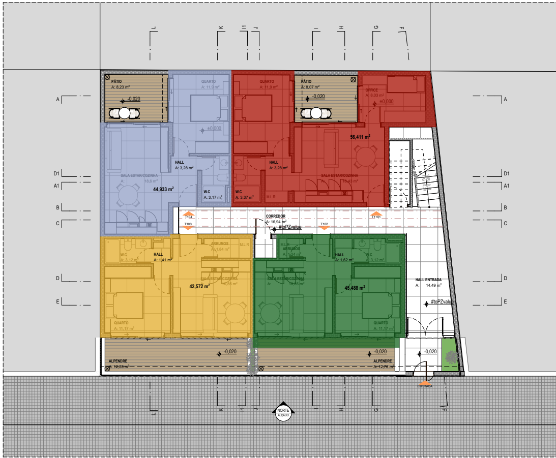
PLANTA MOBILADA_PISO TÉRREO 1:100