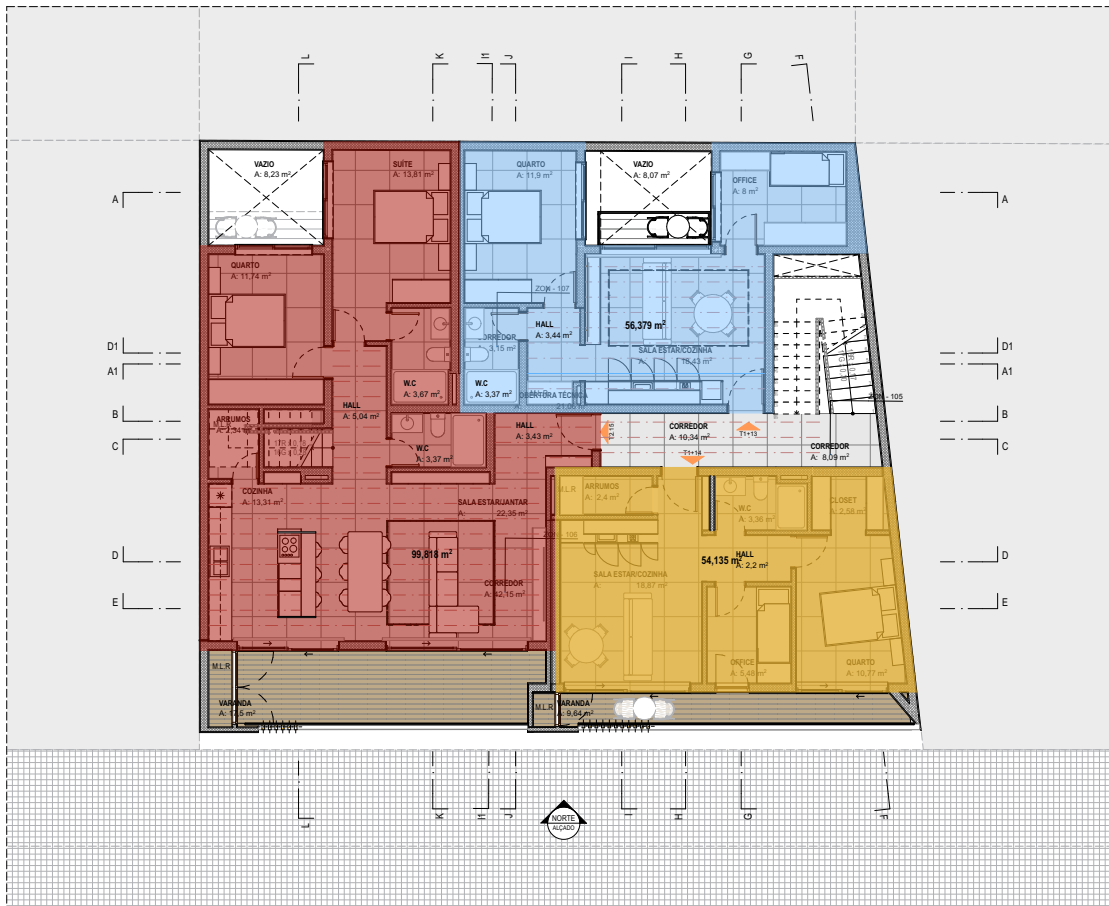
PLANTA MOBILADA_PISO 3 1:100

obs. Todas e quaisquer alterações efectuadas ao projecto, deverão ser submetidas à aprovação da equipa projectista e do cliente. Todos os elementos necessários para a melhor compreensão do projecto deverão ser solicitados à equipa projectista. A equipa projectista não se responsabiliza por alterações de projecto realizadas em obra sem prévia comunicação; TODAS AS DIMENSÕES SER VERIFICADAS EM OBRA.