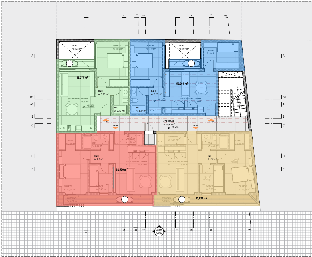
PLANTA MOBILADA_PISO 2 1:100