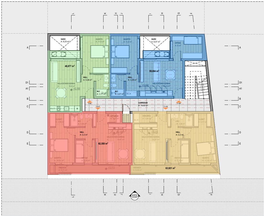
PLANTA MOBILADA_PISO 1 1:100