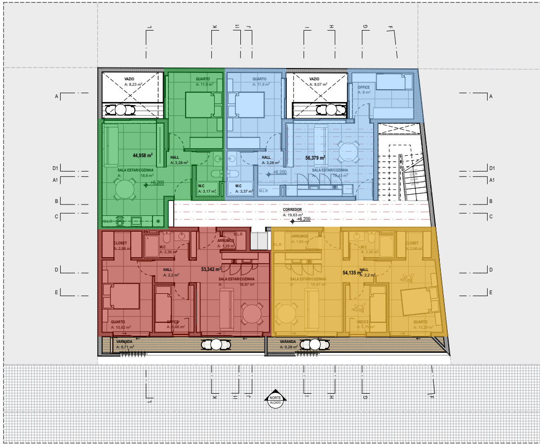
PLANTA MOBILADA_PISO 2 1:100

obs. Todas e quaisquer alterações efectuadas ao projecto, deverão ser submetidas à aprovação da equipa projectista e do cliente. Todos os elementos necessários para a melhor compreensão do projecto deverão ser solicitados à equipa projectista. A equipa projectista não se responsabiliza por alterações de projecto realizadas em obra sem prévia comunicação; TODAS AS DIMENSÕES SER VERIFICADAS EM OBRA.