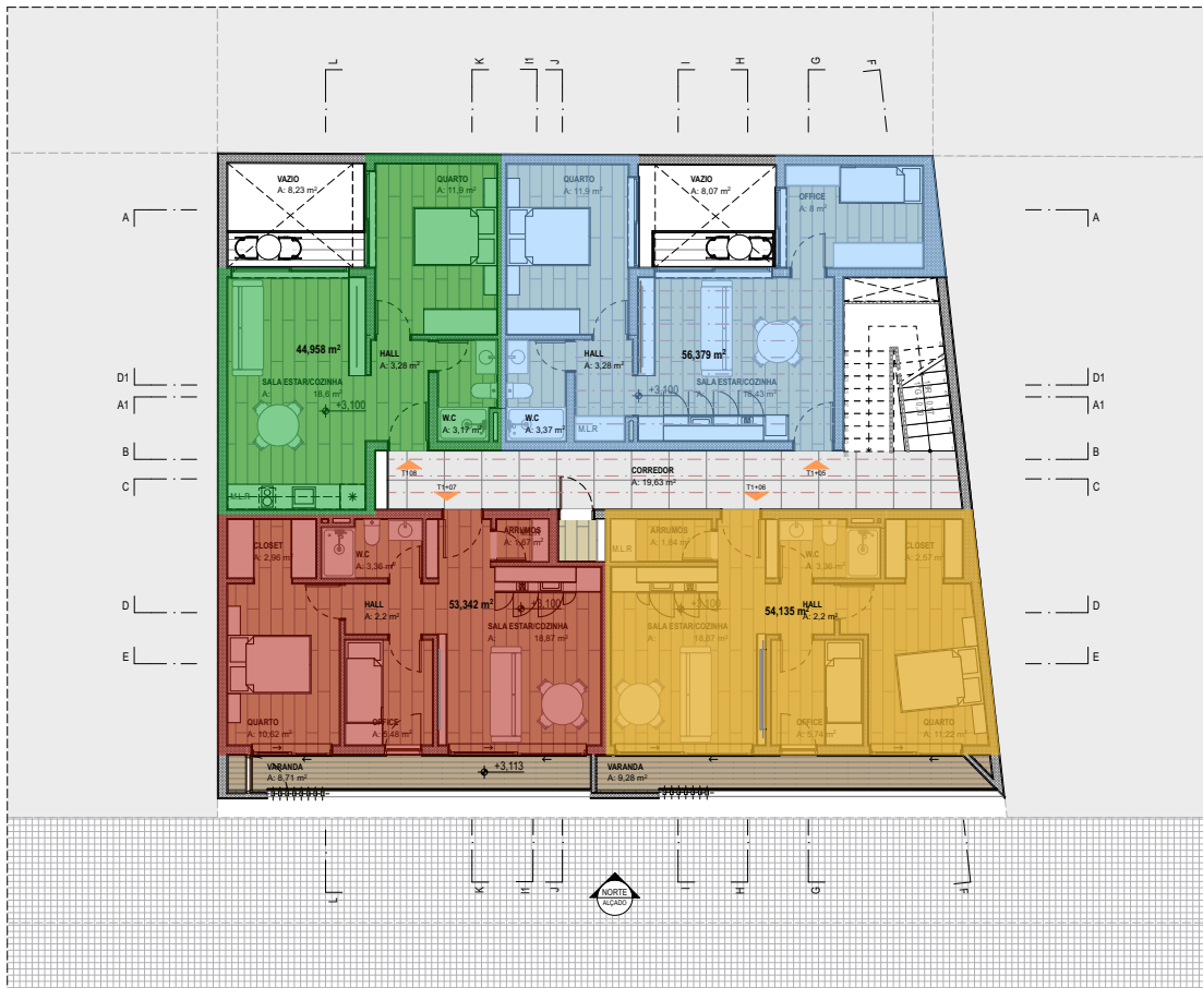
PLANTA MOBILADA_PISO 1 1:100

obs. Todas e quaisquer alterações efectuadas ao projecto, deverão ser submetidas à aprovação da equipa projectista e do cliente. Todos os elementos necessários para a melhor compreensão do projecto deverão ser solicitados à equipa projectista. A equipa projectista não se responsabiliza por alterações do projecto realizadas em obra sem prévia comunicação; TODAS AS DIMENSÕES SER VERIFICADAS EM OBRA.